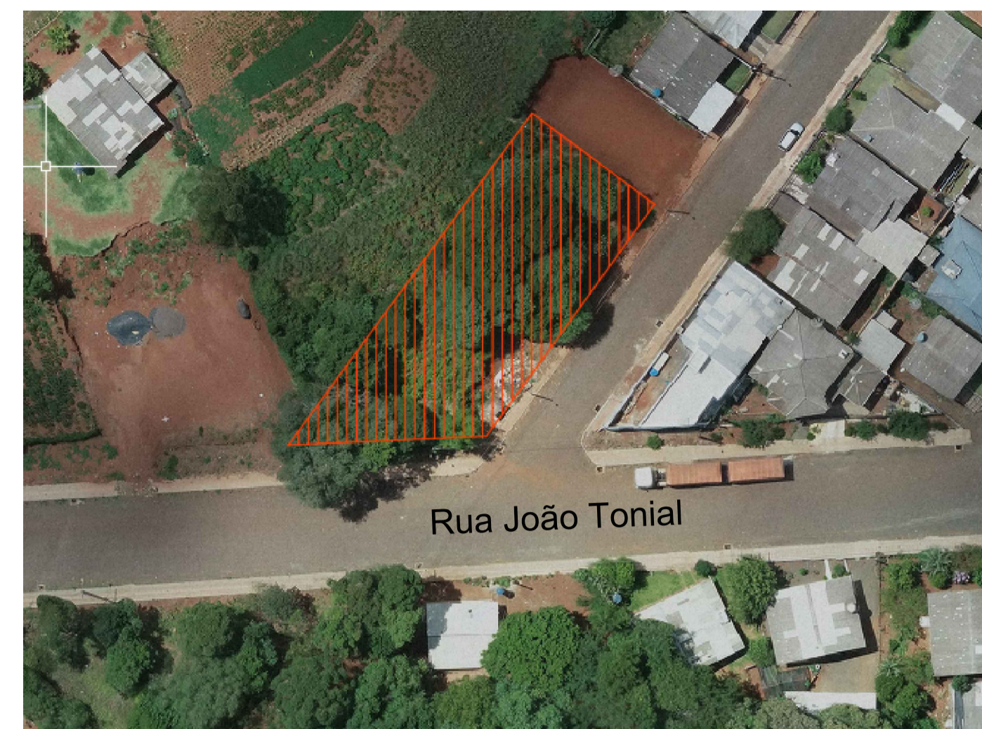
PLANTA DE SITUAÇÃO Sem Escala