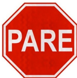
Figura 1: Placa de Sinalização R-1 – Parada Obrigatória.

O posicionamento da placa deve ser colocado no lado direito da via, conforme especificado em projeto, o mais próximo do ponto de parada do veículo.