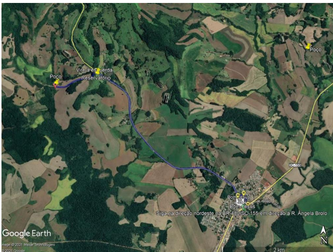
Figura 1: Mapa demonstrando o acesso e a localização da obra na Linha Bom Jesus