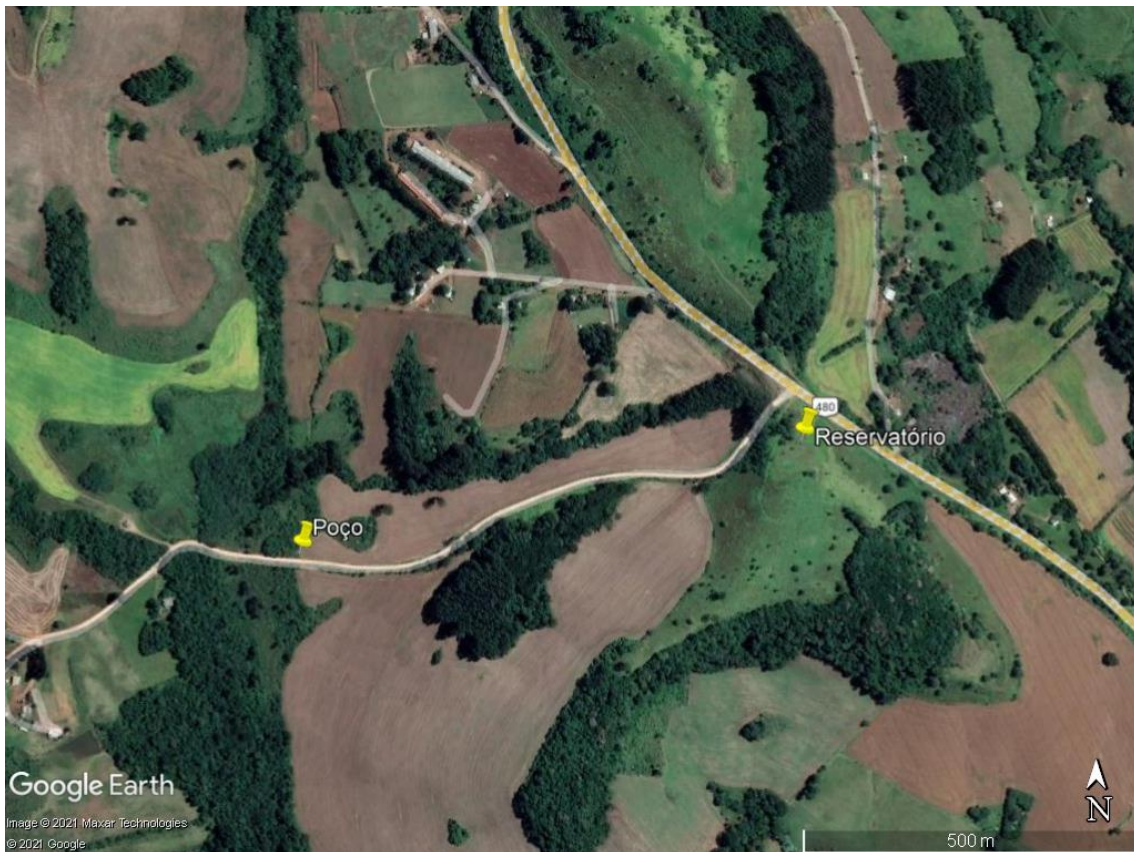
Figura 2: Imagem do local do poço e do reservatório.